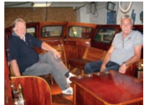
Veterankameratene på plass.

gang. Grim har kjørt med denne bilen siden 1981. På gamle Skotfoss bruk åpnet nok en gang Veterankameratene garasjen for å vise frem det de holder på med. Det var lite fremmøte både på Tors Plass og hos veterankameratene, men været får ta skylda. Takk til alle som stilte.