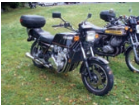
Bak Kawasaki 750 2 takt og foran Kawasaki 1300ccm 6 sylindre. Berømte motorsykler.