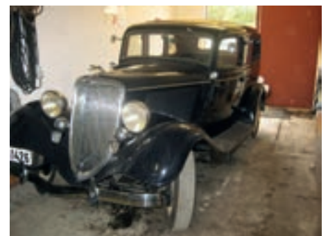
Klar til bruk.