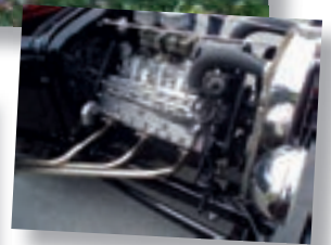
En nydelig motor