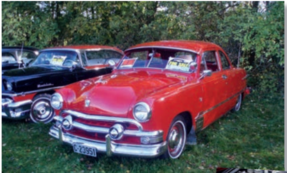
Grombiler til salg